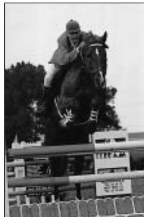
2559 GENIUS-11 ORLING (Genius - 728 Kompase)

Chovatel: Hřebčín Netolice, nar. 90, zúčastňuje se soutěží -ST-.