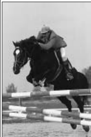
2629 JERSEY ORLING (Equador - po Rigoletto)

Hřelec importovaný z Holandska. Nar. 91, zúčastňuje se soutěží na úrovni -S-. Šampion 4-letých.