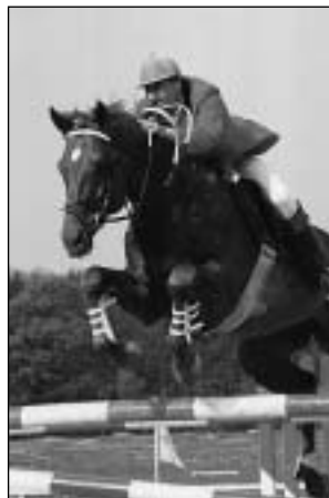
2585 VALÁT-19 BREVIL (Valát ** - po Diktant III)

Hřelec importovaný ze SRN. Nar. 92, zúčastňuje se soutěží na úrovni -L- a -S-. Vicešampion 5ti letých.