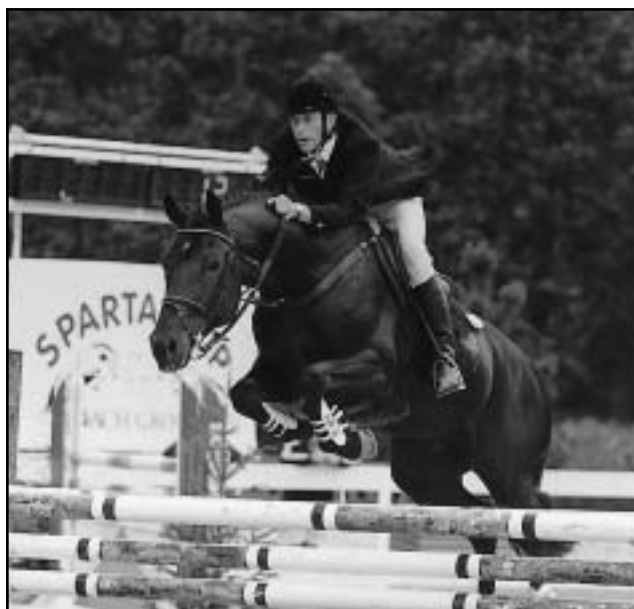
Druhé Chotýšany se změnilý ve festival stáje BOST a P. Doležala. Svůj fanklub odměnil vítězstvím v kvalifikaci soutěže B KRIS (vpravo) a aby toho nebylo málo, kvalifikaci soutěže A vyhrál CRAZY BOY