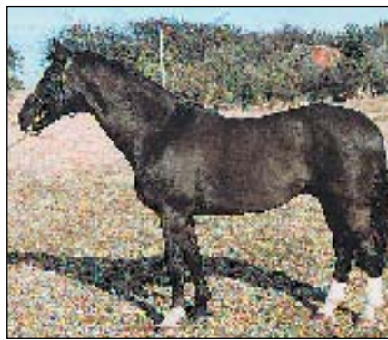
JASPIB (Jasper - Wiada B po Porter holšt.)