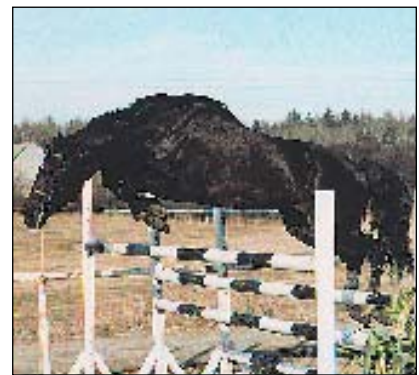
297 FRÜHESCH 2 (Frühesch - Arie po Cent)

chovatel: KWPN, majitel: ZH Pisek Hřebec holandského chovu, prověřen v Německu ve skokových soutěžích -TT-. Účastník světových soutěží, např: CSF Boisleroy, CSIO Linz, CSI Palermo