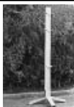
Vnitřní a venkovní boxy dle evropských parametrů