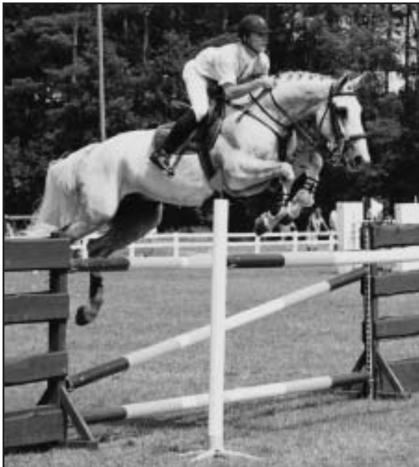
A. Opatrný a ANDOLPH se líbili v Hradci Králové a úspěšní byli i o týden později v SRN

A. Opatrný přivezl z ČR koně ANDOLPH, JESSICA, CRAZY LOVE a PANTA RHEI a navíc