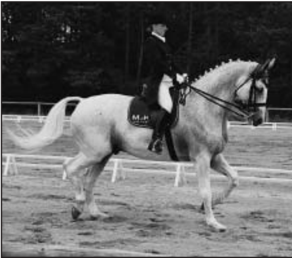
Mistryně pro rok 2001 v drezuře Š. Koblížková - RASPUTIN

Z tohoto pohledu se zdá poněkud předčasná euforie, která ovládla drezurní vedení, které při improvizované schůzce v Hradci Králové naznačilo záměr zvýšit pro příští rok sportovní technické podmínky směrem k úloze IM II. S touto úvahou se nám svěřil manažer drezurní komise Z. Beneš: „Jedná se zatím o velmi předběžný