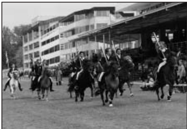
Islandští koně jsou dnes v Evropě na hipologických výstavách nejvíce zastoupeni. V Pardubicích je předvedli němečtí chovatelé.