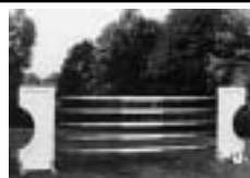
Překážky + příslušenství (lišty, háky, bariéry)

EKVITAN PLZEŇ s.r.o. Jasná 4, 312 08 Plzeň Tel./fax: 377 451 914