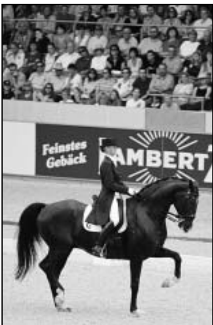
Anky van Grunswen - GESTION SALINERO

Večer pak přešel přes celou oblast tajfun doprovázený silným deštěm a tak mohli být pořadatelé rádi, že se vše přeci jen dobře stihlo.