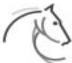
FEI World Equestrian Games Aachen 2006