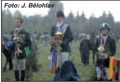
I dekorování soutěže jednotlivců probíhalo v Pardubicích za deště

limity vypsané FEI pro účast na evropském šampionátu, byly správné.