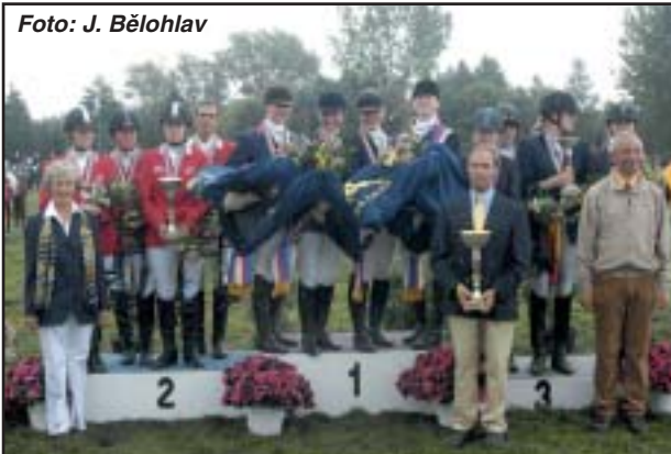
Dekorování nejlepších evropských týmů