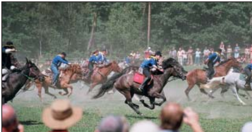
V Hněvšíně nedaleko Slapské přehrady se v sobotu 19. srpna konal 6. ročník Memoriálu gen. G. A. Custer. Ten neúnavně organizuje V. Vydra a letos se v Hněvšíně sjelo téměř 200 koní. Během jediného nácviku zvládla tato obrovská skupina docela dobře sevcit vystoupení, které bylo divákům představeno jako vojenské manévry. Závěr patřil atraktivnímu jízdnicmu útoku a mnozí návštěvníci si poprvé uvědomili jakou obrovskou silou disponovala kavalérie.