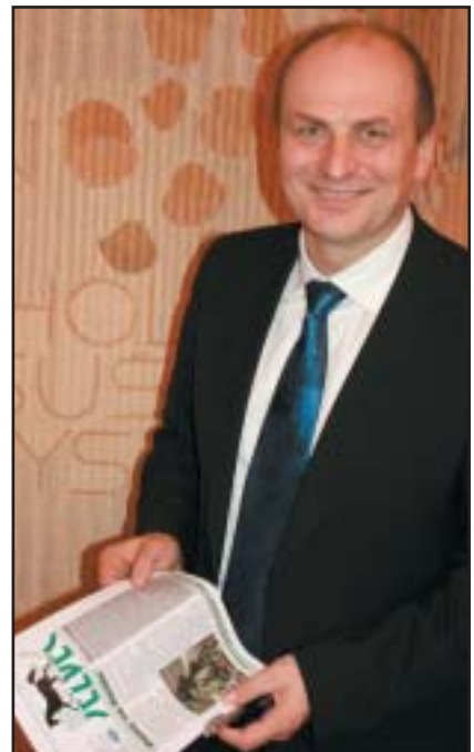
Ministr zemědělství ČR Petr Gandalovič