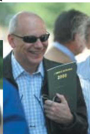
Oficiální tiskovinou návštěvy se stala Jezdecká ročenka 2008, která byla vydána v anglické verzi