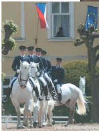
Čtverylka starokladrubských běloušů