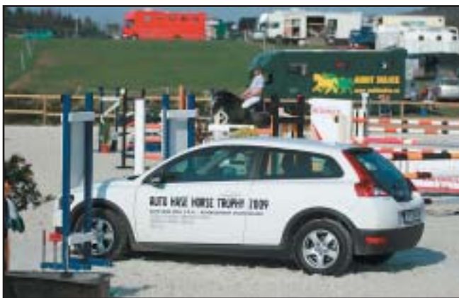
Pořadatelé Auto Hase Trophy dorazili do Opřetic se svými vozy a kolbiště bylo ozdobeno i nejatraktivnější cenou letošní sezóny

Bohatou sezónou, která bude pochoptitelně pokračovat v Opřeticích i ve druhé části roku doplňují prázdninové programy pro děti na pony i jezdecká škola. I KMK se do Opřetic ještě vrátí a vedle zahajovacího kola bude Opřetickému dvoru svěřeno i závěrečné kolo 19. srpna.