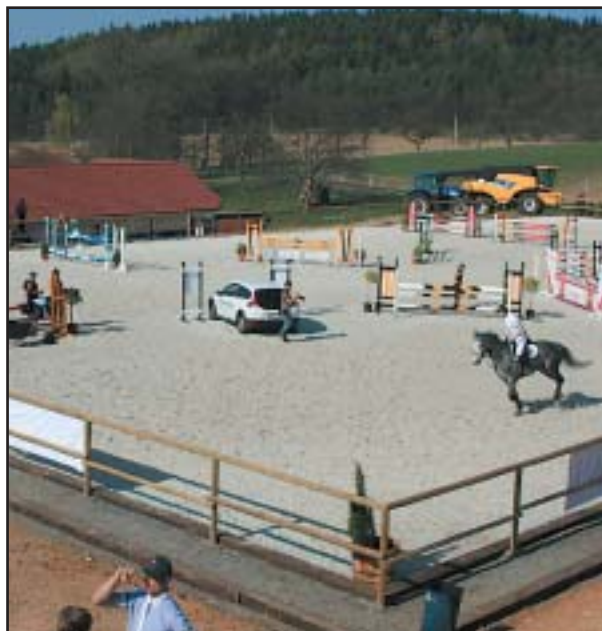
Kolbiště nového areálu Opřetic dvůr

Všichni ti, co se do Opřetic o Velikonočních nedostali, mají další příležitost 25.