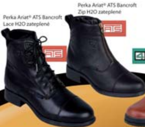
Perka Ariat® ATS Bancroft Lace H2O zateplené