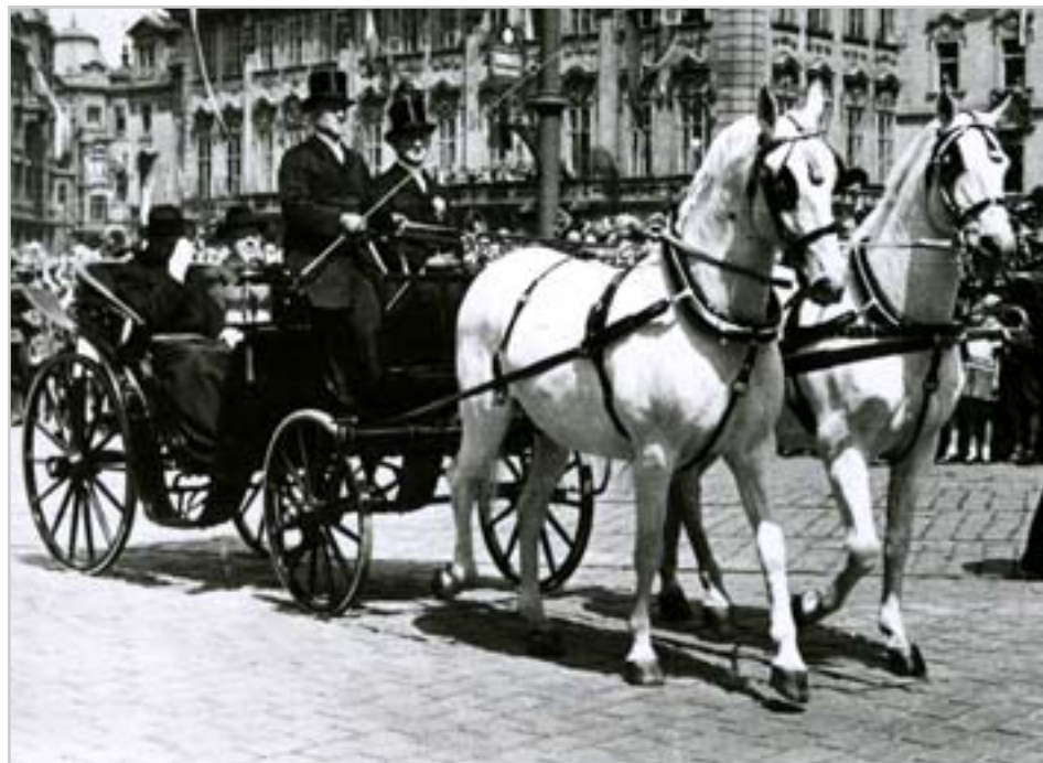
Díky prezidentovi Tomáši Garrigue Masarykovi byli starokladrubské koně váženy i za I. republiky