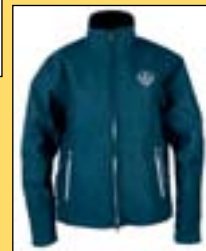
Dámská bunda Pfiff Loreana