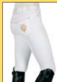
Bílé rajtky dámské Pfiff Julie