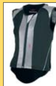
Pátevní chránič SWING