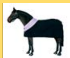
Odpocovací fleecová příkrývka