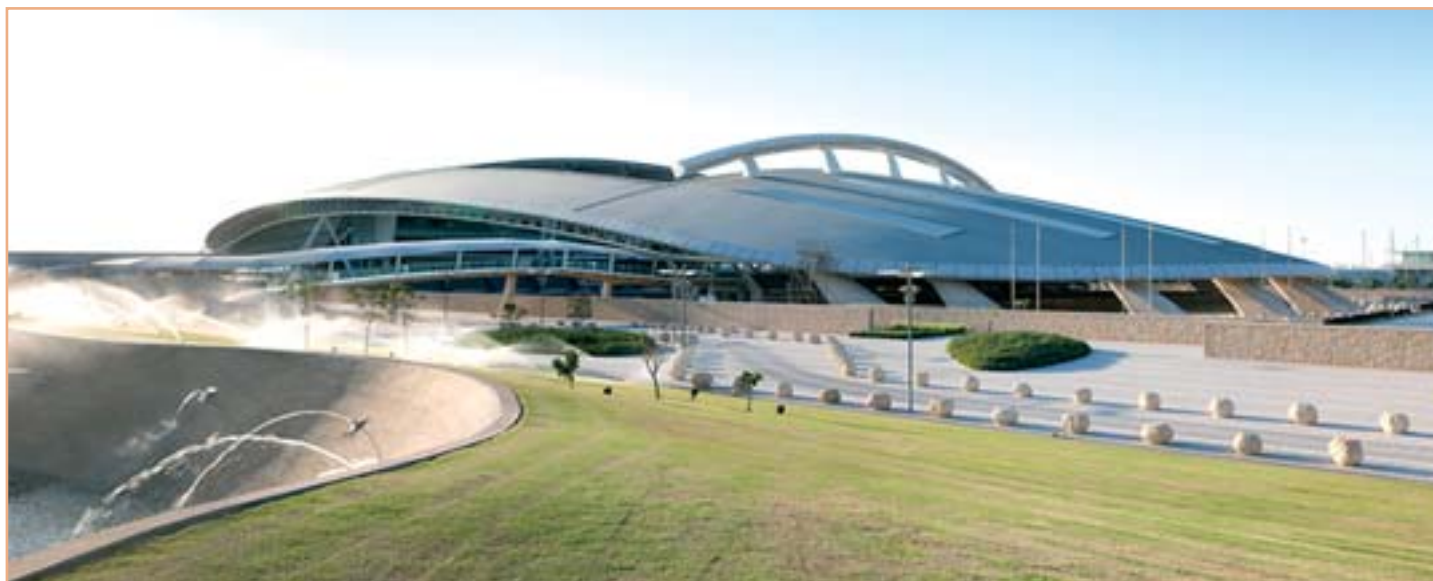
Při pohledu na areál Al Shaqab alespoň víme, kam putují i naše peníze vyměněné za plné nádrže

Vítěz Velké ceny Al Shaqab Gerco Schröder na LONDON na archivním snímku z OH v Londýně