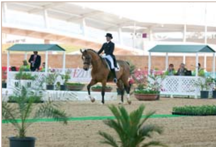
drezura ale měla premiéru

Zahraniční rubriku připravuje Václav K. Dvořák