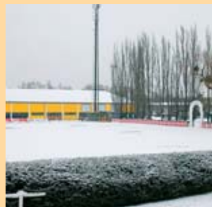
Kolbiště v Linzi ve čtvrtek 28. března