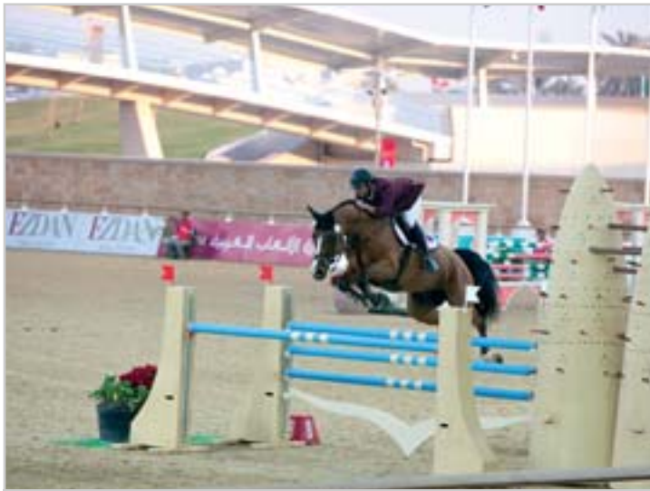
Skokový sport přitahuje arabské prostředí již dlouho,

Podrobnosti najdete na stránce www.chialshaqab.com