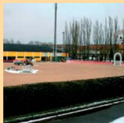
a o 24 hodin později v pátek 29. března