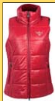
Jezdecká vesta Pfiff Sára