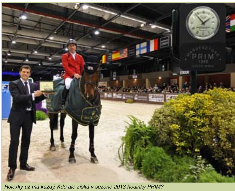
Rolexy už má každý. Kdo ale získá v sezóně 2013 hodinky PRIM?