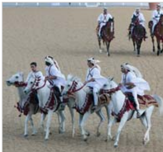
Zahájení patřilo arabským koním

První náročnou zkouškou byl ve středu parkur do 150 cm, na čas a bez rozeskakování. Nejrychlejší bezchybnou jízdou předvedl známý francouzský rutinér Roger-Yves Bost s 13letou ryzkou CASTLE FORBES COSMA (Couleur Ru-