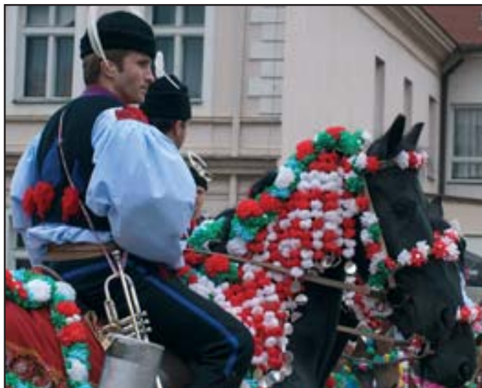
Ve dnech 16. - 18. května v Kunovicích a následně 23. - 25. května ve Vlčnově na Slovácku se konala každoroční Jízda králů. Tato jedinečná folklórní akce byla zařazena do projektu Festival koní Moravy společnosti HYJÉ - koně, o.s.