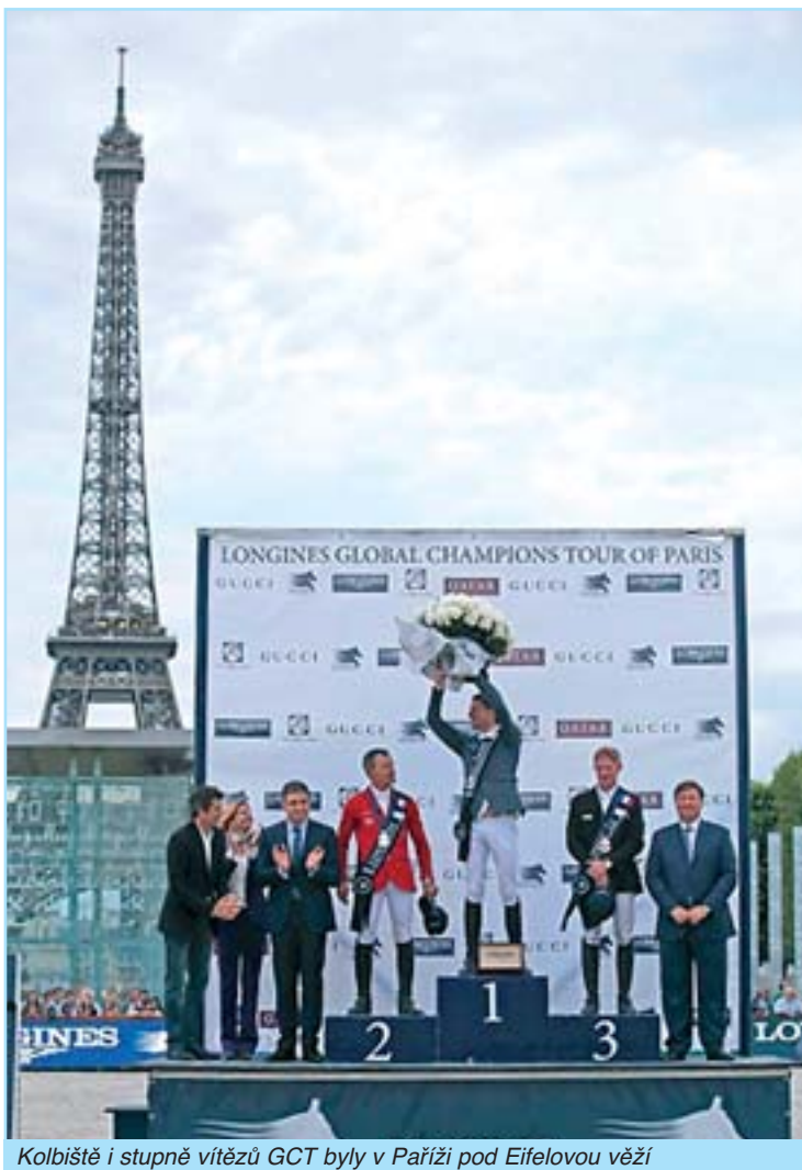
Kolbiště i stupně vítězů GCT byly v Paříži pod Eiffelovou věží

Posledním startujícím byl domácí existenci Evropy Kevin Staut s 15letou bělkou SILVANA HDC. V dábelkém tempu se mu podařilo dosáhnout cíle ze všech nejrychleji. Kevin Staut se dočkal triumfálních ovací a především šeku na 105,6 tisíce EUR. Příští kolo bude 12. července v portugalském letovisku Estoril. Výsledky na www.globalchampionstour.com