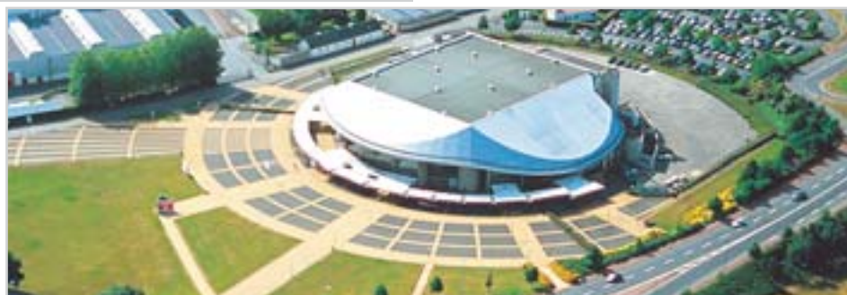
Výstaviště v Caen Zénith bude centrem voltáže a reiningu

Jméno hřebčína Le Pin je známé nejenom jako institucionální centrum francouzského chovu, ale především jako centrum francouzské historické chlouby - chovu plemene Percheron. Ve Francii je má toto místo přezdívku Versailles koní a založil je v 17. století Ludvík XIV. Toto místo bude hlavním stanem všestrannosti. Ve dnech 28. a 29. srpna se zde budou konat