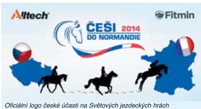
Oficiální logo české účasti na Světových jezdeckých hrách

V roce 2006 pak na nejvyšší úrovni vyzvedli organizaci Němci v Cáchách a konečně přišla nabídka k pořadatelství z USA. I poslední hry v roce 2010 tak skončili úspěchem a zdá se, že tradice společných světových šampionátů je již skutečně pevně ukotvena.