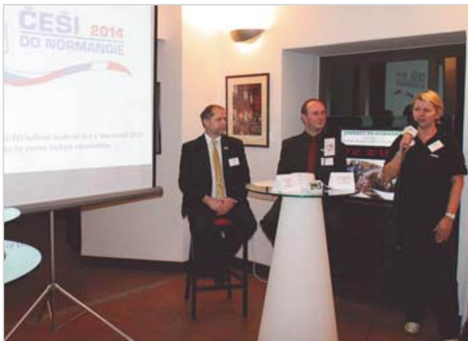
Reprezentační plány představili zástupci jednotlivých disciplín

Rezervace vstupenek na SJH je již v plném proudu a můžete ji udělat prostřednictvím oficiální stránek her www.normandy2014.com