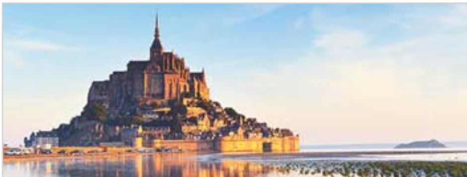
Záliv s klášteřem Sv. Michala

budou probíhat ve dnech 25. až 29. srpna. Do prostor závoděšti se vejde 25 000 návštěvníků.