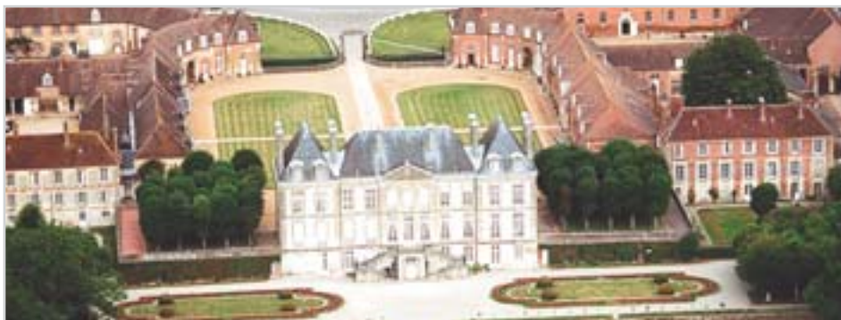
Národní hřebčín Le Pin

300 aktérů, včetně 100 jezdců, předvede v rámci zahájení 30 scén, které ukáží, že všechny jezdecké cesty vedou právě do Caen.