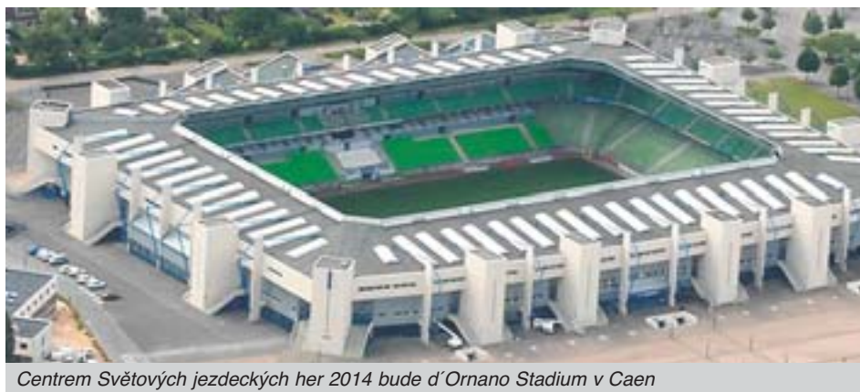
Centrem Světových jezdeckých her 2014 bude d'Ornano Stadium v Caen

Slavnostní ceremoniál bude vyvrcholením celosvětového oslovení milovníků koní, které oslavuje pouto mezi člověkem a koněm. Přes