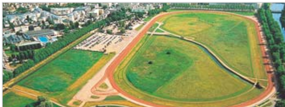
Dostihové závoděšti La Prairie bude dějištěm soutěží čtyřspřeží a paradrezury

Závoděšti La Prairie se stane dějištěm i paradrezurního šampionátu. Jeho soutěže