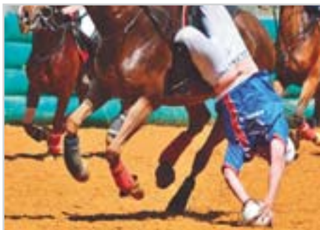
Horse-Ball (ilustrační foto)

A konečně městečko Saint-Lô bude ve dnech 27. až 31. srpna patřit jezdecké hře Horse-Ball, při které se hráči snaží kožený míč doplněný šesti úchyty nejprve sebrat ze země a posléze dopravit do visle zavěšené kruhu, která visí 3,5 metru vysoko. Hra se hraje na dva poločasy (10 minut) na hřišti o dlouhém 60 až 80 metrů a širokém 20 - 30 m.