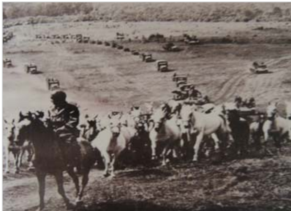
Evakuace lipicánů z Hostouňského hřebčína v roce 1945