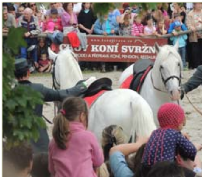
Z vystoupení slovenských lipicánů ve Svržně při oslavách 100letého výročí založení hřebčína v Hostouni

Část stáda byla jako válečná kořist převezena do USA a část byla vrácena do slovinské Lipice.