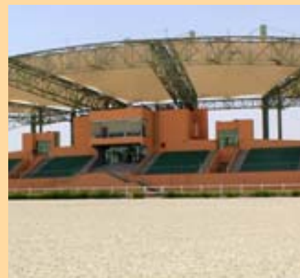
Luxurní areál v Al Ain