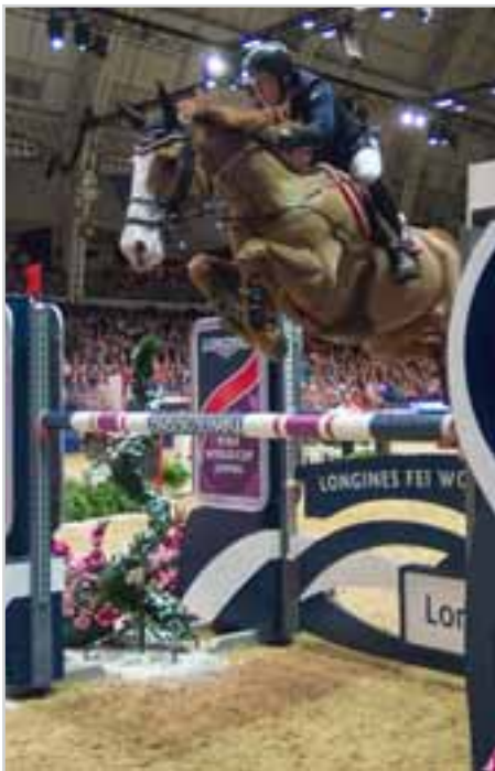
V kvalifikaci SP v Londýně skončil na třetím místě Michael Whitaker na VIKING