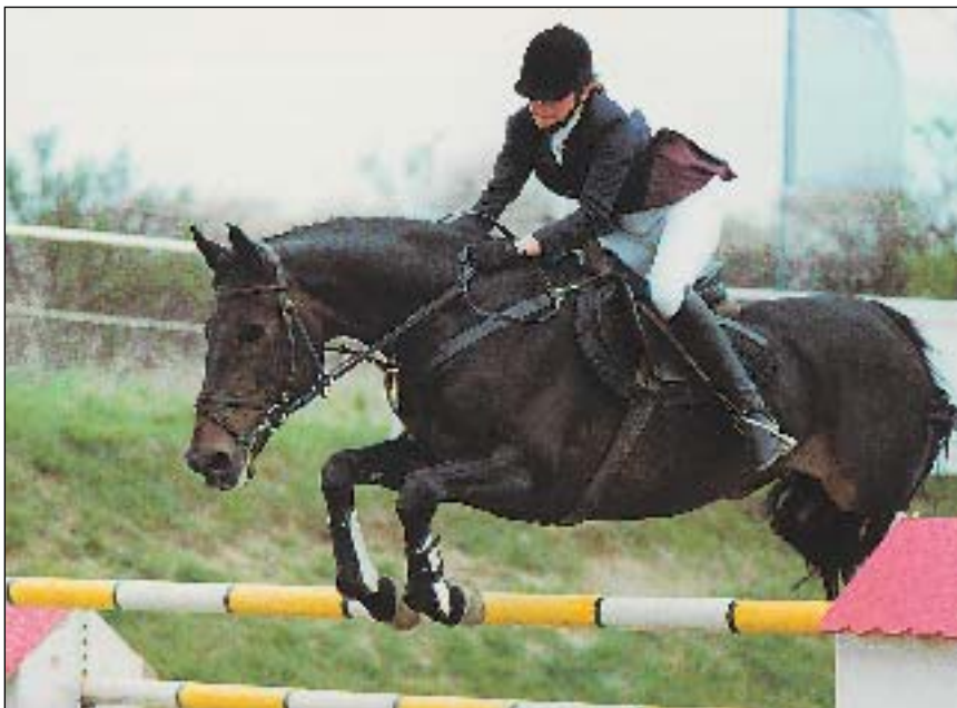
Z. Zelinkovou a FOBOSE nyní čeká VC Poděbrad