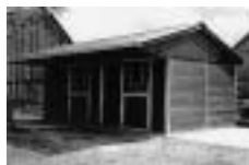
Vnitřní a venkovní boxy dle evropských parametrů

Sportovní a obchodní stáj Vondráček - Starosta