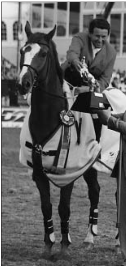
Kolikrát ještě bude E. T. triumfovát tak jako v letošních Cáchách?

Další místa za E.T. ve Velké ceně Stutt-