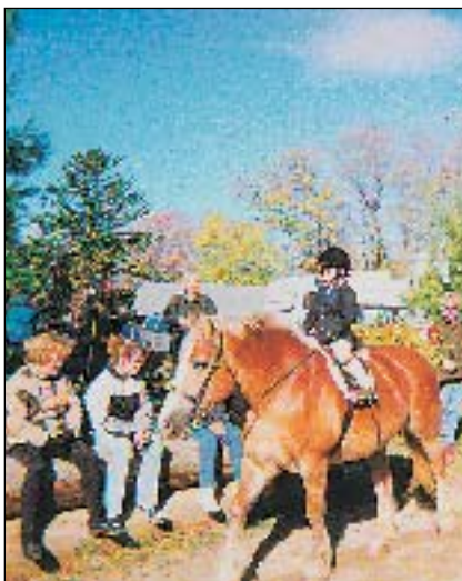
I malý kůň je někdy velký