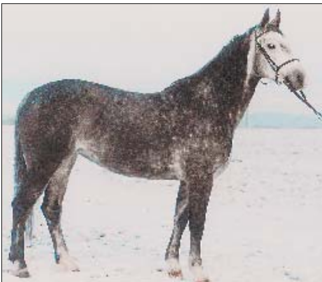
Elegantní a nadějná MY FAIR LADY