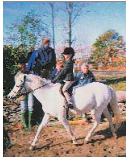
Obrázek jak z učebnice jezdeckví bohužel zatím na našich kolbištích vidíme jen zřídka

Soutěže Equitation se již více blíží ke klasickým soutěžím. Kurs parkúru je velmi podobný tomu, co k nám přivezl K. H. Streng a jezdec musí v první části parkúru přecházet do klusu, skákat z klusu, zastavovat, couvat či nacválat do kontrakvalu, udržet kontrakval po celou dobu oblouku a z kontrakvalu i skákat apod. Ve druhé části pak samovolně vjede do úseku, který je již soutěžního charakteru a na několika skocích může demonstrovat rychlost a soutěžní obratnost. Celý tento systém mě nadchnul svojí nenásilnou formou, která však zcela důsledně všechny donutí ubírat se určeným směrem. Celý systém ani tak není o koních, ale je v každém případě o lidech. Od čtyř let pak každé dítě ví, že prostě soutěž nemůže nikdy vyhrát ten kdo špatně sedí, či neumí vést koně. A když potom sedíte v Madison Squar Garden a vidíte všechny i ty neznámé americké jezdce musíte uznat, že je to na americkém jezdeckví vidět.