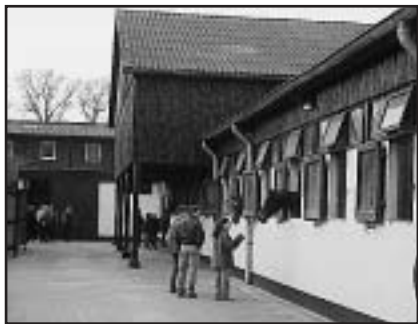
Stáj sportovních hřebců v Zangersheide -kd-

Její součástí by měly být čtyři tříhvězdičkové soutěže (Gatcombe - GBR, Scarvagh - IRL, Bonn-Roddergerg - SRN a North Georgia - USA) a dvě soutěže na úrovni dvou hvězd (Chantilly - FRA a Torino - ITA). Celkové vítězství v sérii pak bude dotováno 9 000 librami.