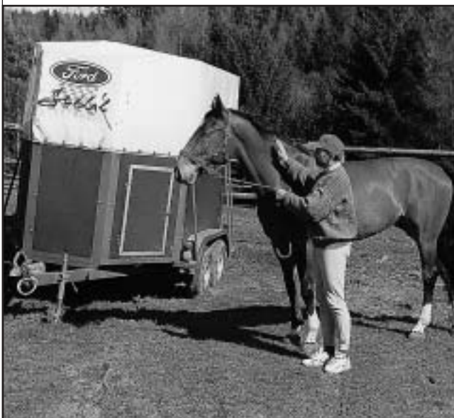
P. Švec i nováček stáje VYŠEHRAD si sice užívají překrásného jihočeského prostředí, ale zase to mají na většinu kolbišť daleko