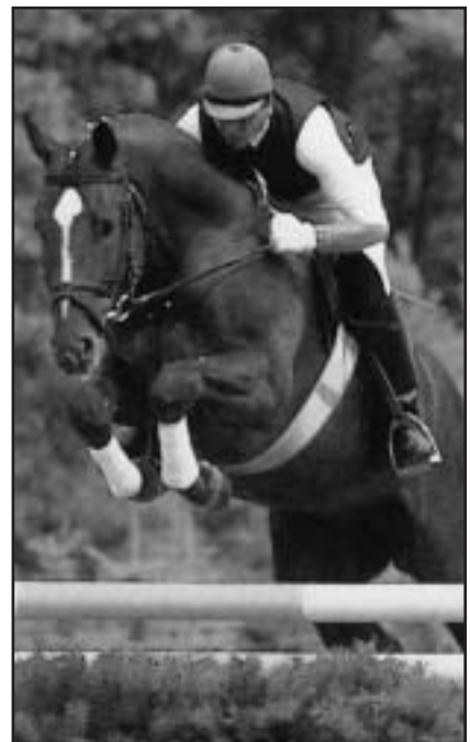
Druhým neúspěšnějším otcem loňské sezóny je ESPRI

Na třetím místě najdeme loňskou jedničku GRANNUSHE. V roce 1997 postrádal GRANNUSH výraznějšího zástupce na mezinárodní scéně. Osmnáctiletý Grannush a patnáctiletý Top Gun La Silla soutěží jen příležitostně a Gaston M není přílišnou nadějí do budoucna. Naopak Remus Equo A. M. Bauera, který se vloni dostal z ničeho až na 123. pozici chovatelského žebříčku a Gratio La Silla vicešampion 5letých z Lanaken, patří mezi mladé talenty a tak pravděpodobně o GRANNUSHOVI ještě uslyšíme. (podle Horse National -kov-)