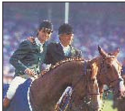
Dnes již oba slavní, Rodrigo a Nelson Pessoa

Sezóna pro naše spřežení je tedy zahájena a nezbývá než se těšit, že v jejím průběhu a na jejím konci nebude naše vlajka chybět ani ve společnosti nejlepších států světa. Hlavně ale, že se v této společnosti naše spřežení neztratí.