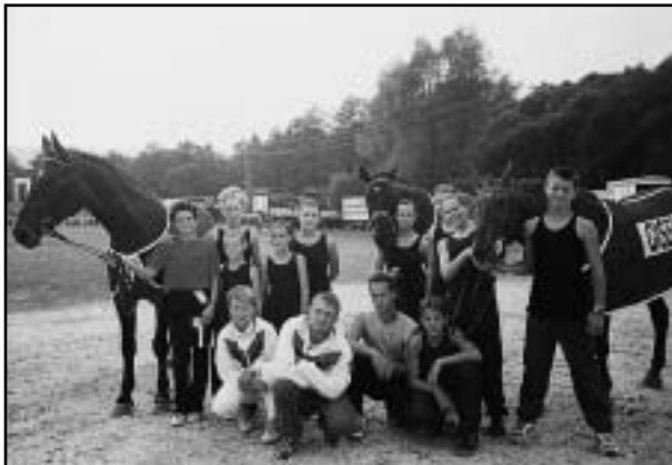
Čs. voltízní ekipa v Košicích

Na pozvání JK Slávia Košice, který byl pořadatelem slovenského šampionátu ve voltíži, se na Slovensko vypravili i zástupci tří českých klubů: Slovanu Frenštát, Lucky Drásov a Voltíží Tlumačov.