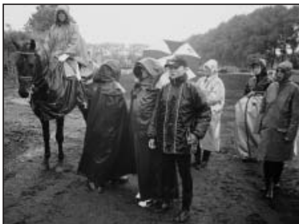
Tak budeme soutěžit nebo ne