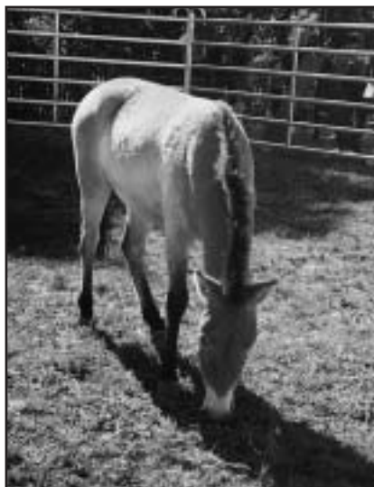
Poprvé mimo Zoo byl vystaven Kůň Przewalského