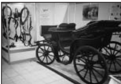
Kočár prezidenta Masaryka včetně postrojů (zapůjčeno NH Kladruby n. L.) zval diváky do kočárovny v Praze 9 ve Ctěnicích