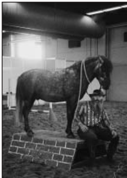
Tradičně dobře pobavili diváky ponny V. Pechana