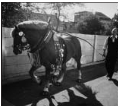
Sílu demonstroval chladnokrevný hřebec BARMAS