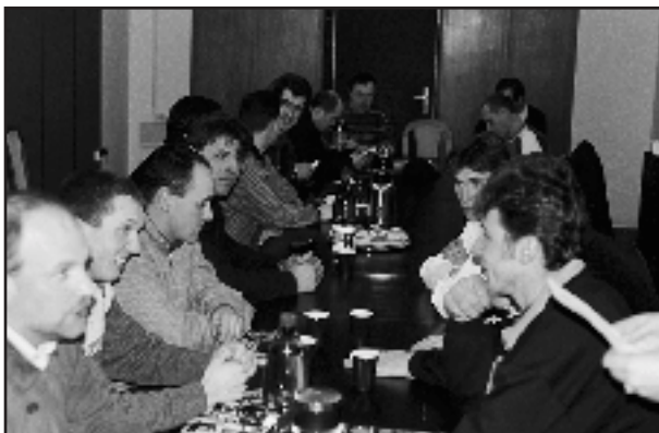
Skokoví jezdci se do zasedací síně v Praze na Strahově málem nevešli

Informaci o výši rozpočtu pro rok 2000 nebyli zástupci ČJF schopni zodpovědět, protože definitivní rozpočet bude schválen až po Valné hromadě ČSTV, která se koná 17. dubna.