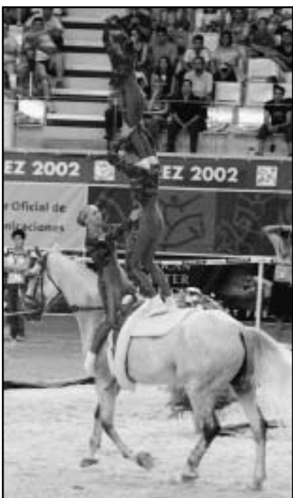
Česká voltíž se v roce 2002 vrátila mezi světovou elitu