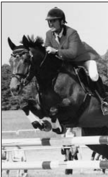
RAMBELLA DESCOR J. Jindry uvolnila místo ve stáji pro šestiletou M-LOUSAN

Pro hřebce ATOM SCHNEIDER bylo přichystáno měření nejtěžší. V průběhu tří dní absolvoval třikrát soutěž stupně -T- (S), včetně Velké ceny (S**). I když dokončil s výsledky 16, 12 a 12 tr. bodů byl J. Jindra i vzhledem k obtížnosti kurzů a lehkosti shození s jeho výkony spokojen.