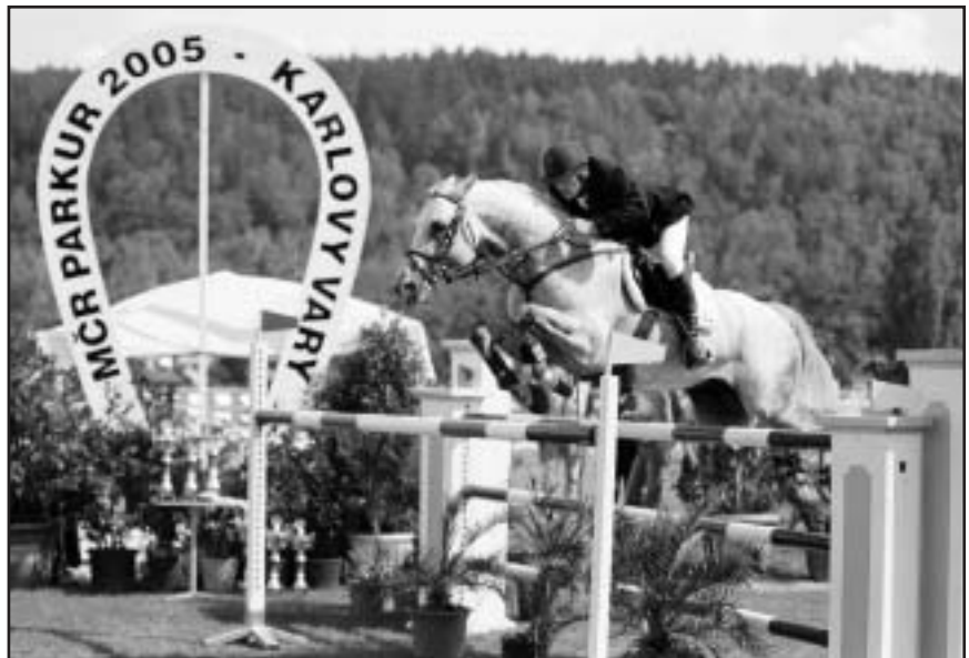
O. Nágr - ATLAS vyskákali bronzovou medaili

ČJF jako hlavní aktér medailového turnaje má nyní čas na analýzu příčin a následků a doufejme, že bude nalezena cesta, jak udržet národní šampionát v centru pozornosti nejen diváků, ale především samotných jezdců.