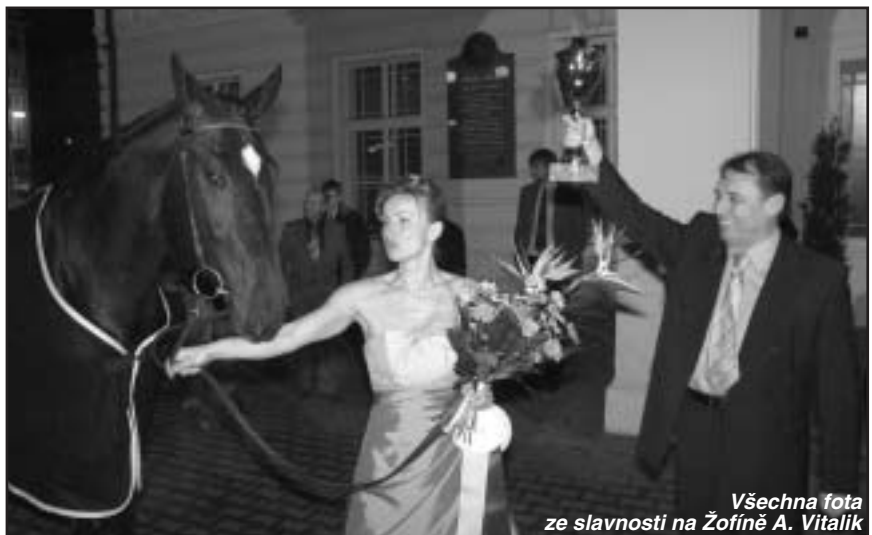
Všechna foto ze slavnosti na Žofíně A. Vitalík