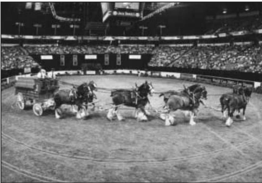
Organizátoři v Las Vegas jistě využijí zkušenosti z finále 2003