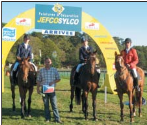
Náš reprezentační tým na šampionátu v Le Lion Angers

Celosvětovým problémem diskuze o povrchu je, že neexistuje oficiální technologie, která by byla vyhlášena jako standard. Na světě tak operuje několik výrobců povrchů, kteří obhajují své technologické postupy a jinak se vše opírá o subjektivní hodnocení účastníků. I proto bychom ve spolupráci s Jezdeckými stavbami, chtěli iniciovat organizaci mezinárodního semináře na toto téma a pokusit se právě o vytvoření nějakého