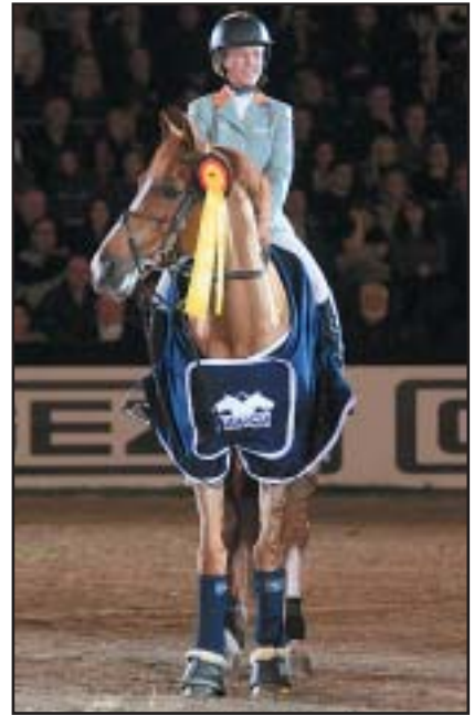
Trojnásobná vítězka Mercedes German Master Meredith Michaels-Beerbaum