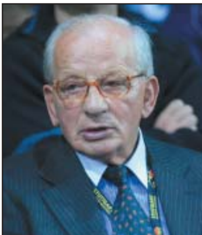
Ve stuttgartské Hans Schleyer Halle byl stále velmi vážený nestor německého jezdectví 86letý Hans Günter Winkler