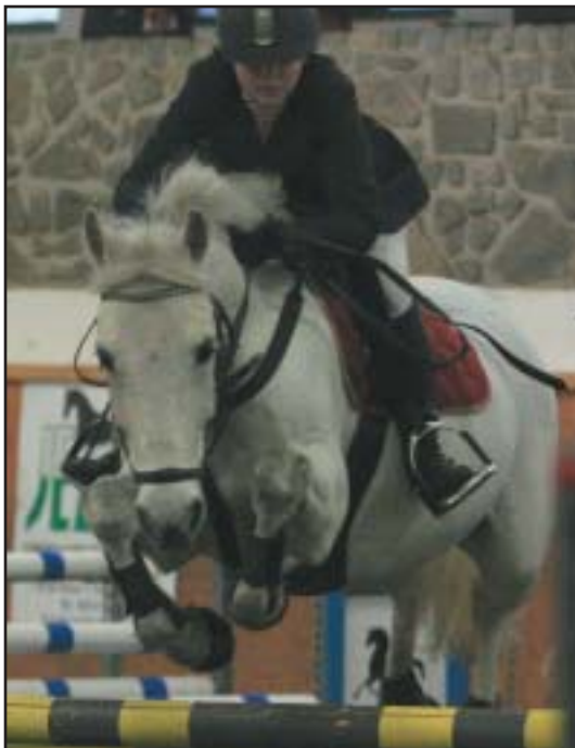
Nejlepším koněm finále Extraligy byl LORINO

Sítem kvalifikací prošli jako nejlepší čtyři účastníci finále Teenager 2008. Všechna finále se jedou vždy znovu od nuly a body získané v celoroční kvalifikaci slouží pouze k určení pořadí pro postup do finále.