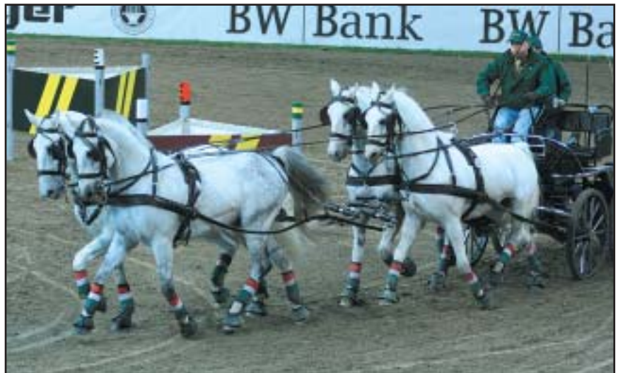
Ve Světovém poháru čtyřspřeží zvítězil tentokrát József Dobrowitz z Maďarska. Potvrdil tak nejenom výborné postavení mezi nejlepšími jezdci světa, ale před dalším kolem SP, které se bude konat v prosinci v Budapešti, pozval do domácí haly i maďarské publikum.