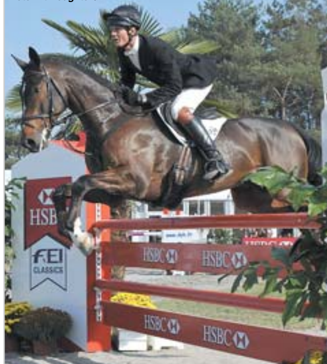
Vítězem závěrečné soutěže seriálu HSBC FEI Classics CCI4* se v Pau stal William Fox-Pitt na OSLO z Velké Británie