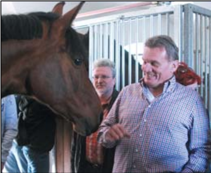
Primátor Prahy MUDr. Bohuslav Svoboda ve ctěnických stájích

Nad celým seriálem mají vždy záštitu vrcholní představitelé Prahy. V neděli 10. dubna slíbil při návštěvě ve Ctěnicích podporu celému seriálu i primátor Prahy MUDr. Bohuslav Svoboda. Rozpisy soutěží naleznete na www.jsctenice.cz a www.in-expo-group.cz