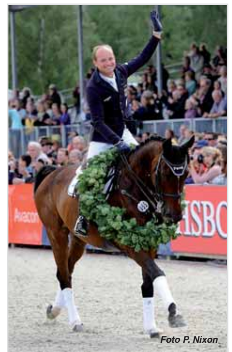
Favorizovaný Michael Jung zvítězil v Luhmühlenu jak v HSBC FEI Classics, tak v německém šampionátu