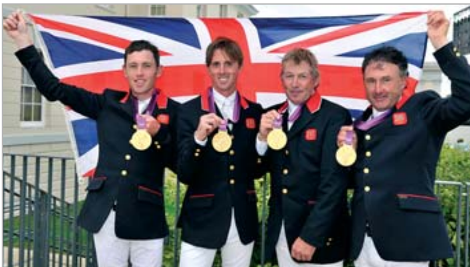
Zlatý skokový tým Velké Británie: Scot Brash, Ben Maher, Nick Skelton a Peter Charles