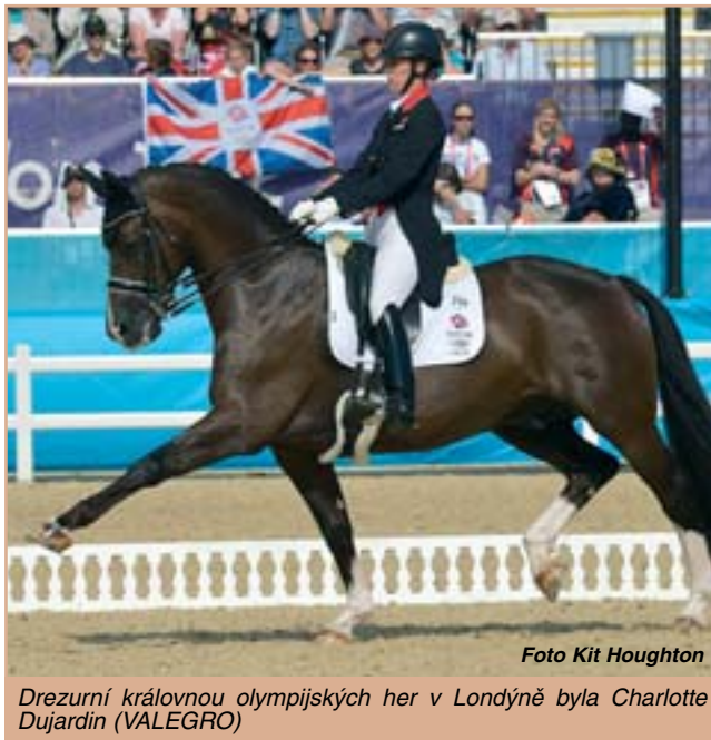
Drezurní královnou olympijských her v Londýně byla Charlotte Dujardin (VALEGRO)

Nádherný zážitek dopřála divákům sestava Laury Bechtolsheimer. Byla technicky náročná a přesně vycházela do působivé hudby. Užasnou energickou jízdou ohromila i Adelinde Cornelissen a mnoho jejích fa-