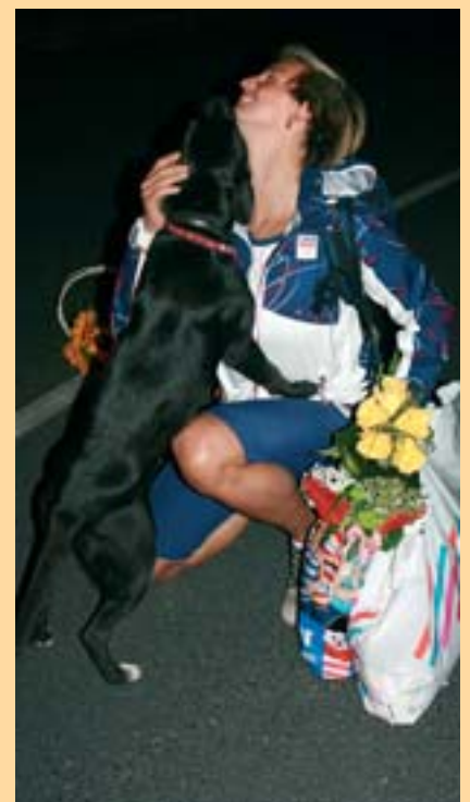
Barbora Špotáková na tiskové konferenci prozradila, že se nyní nejvíce těší na svého psa. Ten jí za chvíli osobně přivítal ještě téměř na letištní ploše.