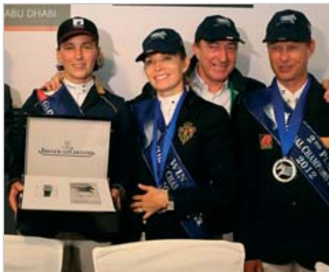
Čtveřice v Abú Dhabí nejspokojenějších. Zleva vítězka závěrečného kola Katharina Offel, vítězka celé série Edwina Tops-Alexander, třetí Michael Whitaker a stříbrný Rolf-Göran Bengtsson.