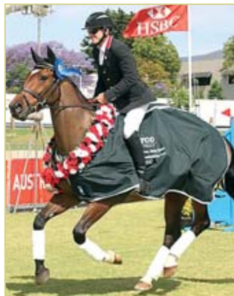
Druhým kolem pokračoval v australském Adelaide 22. do 25. listopadu seriál soutěží všestrannosti HSBC FEI Classics 2012/2013.

Současný ročník má celkem šest pokračování. Již se konala kola v Les Etoiles de Pau CCI 4* (FRA) a nyní Australian International 3 Day Event (AUS). V příštím roce se pak budou do seriálu započítávat výsledky z Rolex Kentucky Three-Day Event (USA) 25.-28. dubna, Mitsubishi Motors Badminton Horse Trials (GBR) - 3.-6. května, Luhmühlen CCI 4* E.ON (GER) 13.-16. června a z Land Rover Burghley Horse Trials (GBR) 5.-8. září.