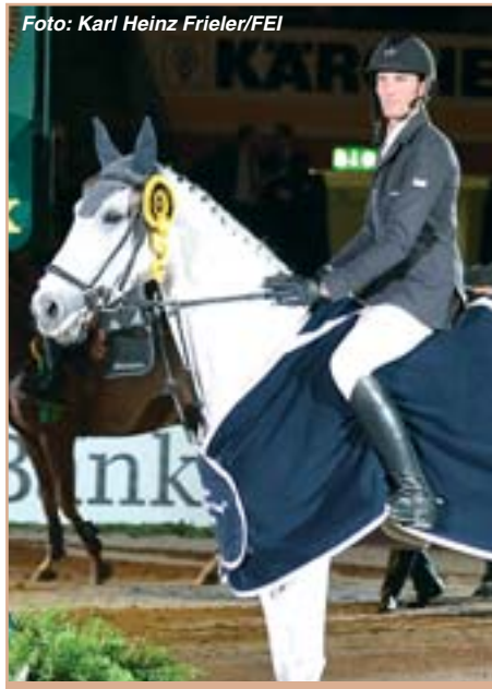
Vítězem páté kvalifikace SP ve Stuttgartu se stal Kevin Staut na SILVANA HDC