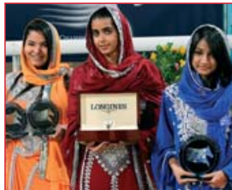
Exotické hostesky při zahajovacím závodě GCT v Doha