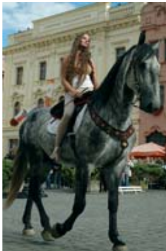
Loňský ročník pardubické výstavy zahajovala Lady Godiva

Pardubickou výstavu podpořil ministr zemědělství ČR, Pardubický kraj i město Pardubice. Proto se koně objeví i v centru Pardubic. Po loňské úspěšné premiéře zavítá v pátek 6. září na Pernštýnské náměstí slavnostní průvod koní, spřežení a dalších účastníků výstavy, který vyjde ze Synthesia Parku. Zde bude v 16:00 hodin výstava oficiálně zahájena při akci nazvané „Koně na náměstí“.