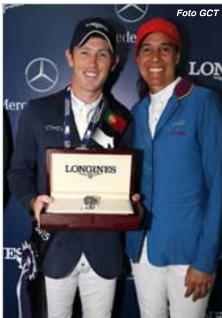
Dva z čela průběžného pořadí GCT Scott Brash a Luciana Diniz