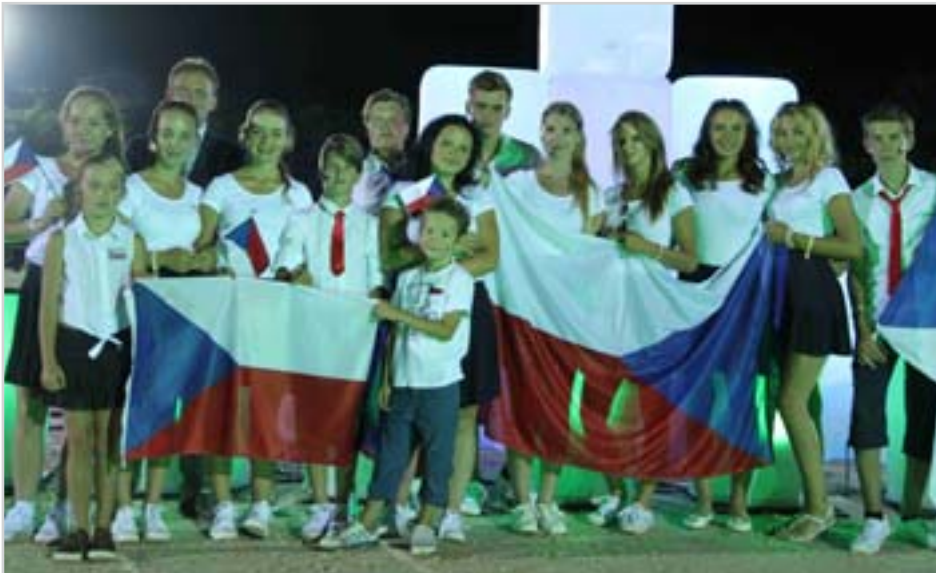
Česká výprava na skokovém ME dětí, juniorů a mladých jezdců ve Wiener-Neustadtu