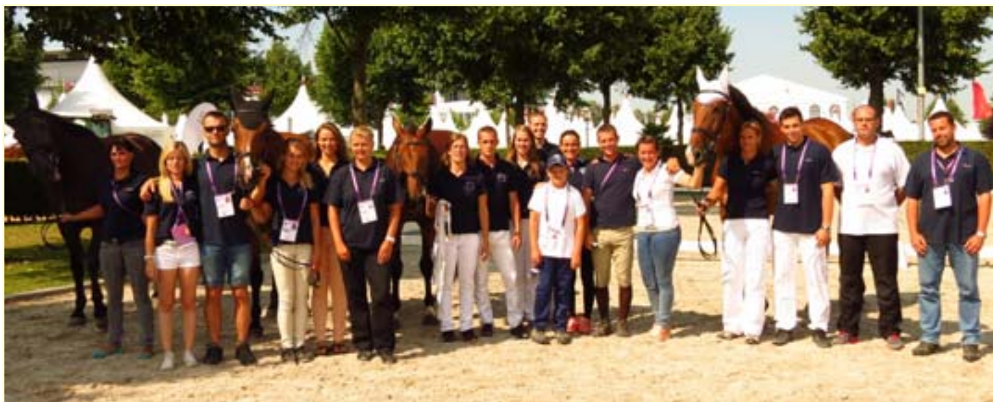
Téměř kompletní česká výprava v Cáchách

V individuálním žebříčku zůstali na prvních místech Pénélope Leprevost, Ludger Beerbaum, Joe Clea a Gregory Wathelet. Na páté se