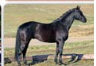
Homburg Hochadel x Landberry Vraněk, nar. 2009, Hann., KVH 163

Během předváděcích dnů budou dále představeni hřebci: