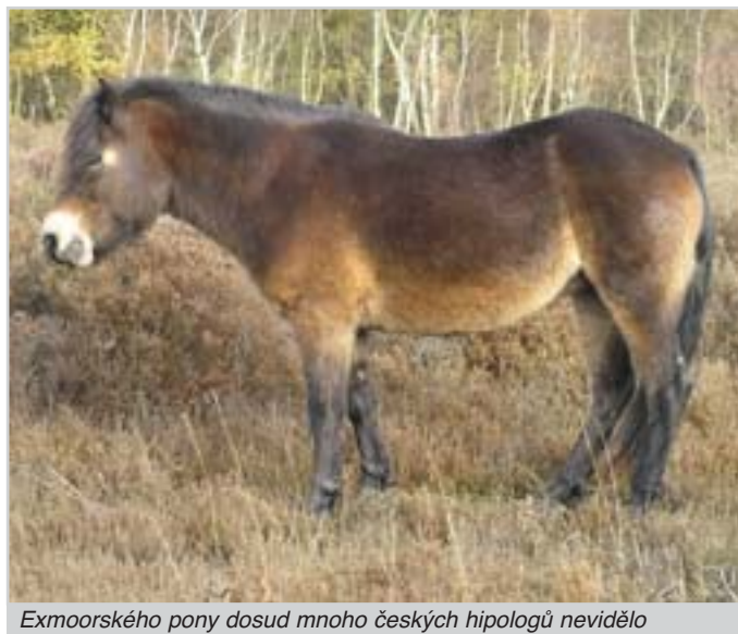
Exmoorského pony dosud mnoho českých hipologů nevidělo

Vezmeme to popořadě: 1) z biogeografických důvodů jsme předem vyřadili plemena, která jsou přizpůsobena na jiné klima a spásání odlišné vegetace, 2) Exmoorský pony prokazatelně nejméně od 11. století, z něhož pochází nejstarší písemný doklad o jeho existenci, žije (polo)divoce na náhorních pláních stejnojmenné oblasti, kde je veden jako divoká zvěř. Stáda žijí bez prostorového omezení, přikrmování a veterinární péče a přesto u něj nejsou pozorovány zdravotní problémy. Chovatelské zásahy jsou omezeny na každoroční naháňku (stáda mají majitele), při níž jsou značena nově narozená hříbata a vybírána zvířata k přesunu, či prodeji do jiných stád, 3) Čistokrevnost exmoorského ponyho je prokázána i geneticky. Jde o jedno z nejdolnějších plemen