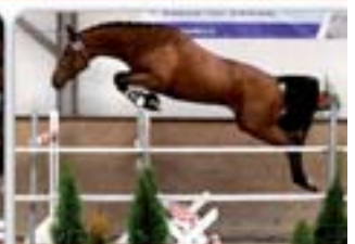
Little Joe Lantlanet x Chacco-Blue Hnědáček, nar. 2012, Old., KVH 166