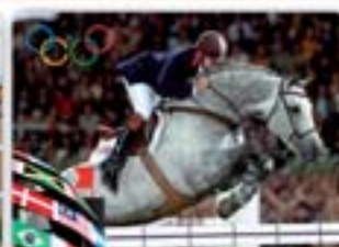
Russel II Cardiffo I x Lincoln Bělouk, nar. 1995, Holst., KVH 170