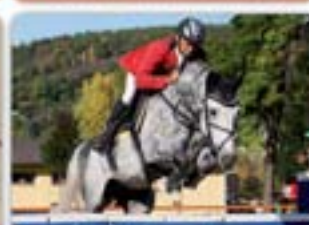
El Paso II Erasida I x Werther Bělouk, nar. 2003, Hann., KVH 168