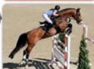
Caruso Carissimo x Capital I Hnědáček, nar. 1996, Holst., KVH 170