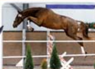
Balcamor Balsobet da Fouet x Cassiano Ryzák, nar. 2012, Holst., KVH 166

Další hřebci v nabídce. Kompletní katalog hřebců Vám zašleme na požádání.