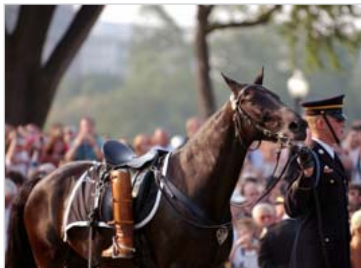
Pohřební symbolika koně, který přišel o svého jezdce