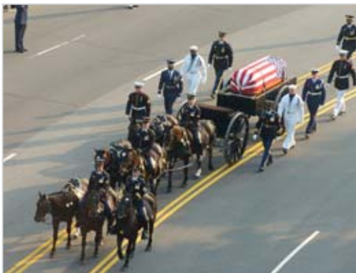
Pohřeb prezidenta Ronalda Reagana v roce 2004

Tyto jednotky naleznete v Coloradu, Texasu, Kansasu a Virginii. Ta poslední ve Virginii je specializovaná na pohřební ceremonie.