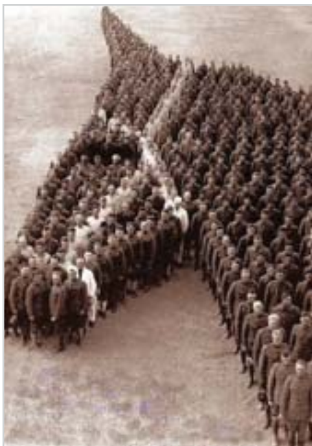
Hold koním 650 příslušníků kavalérie v roce 1916 v Novém Mexiku