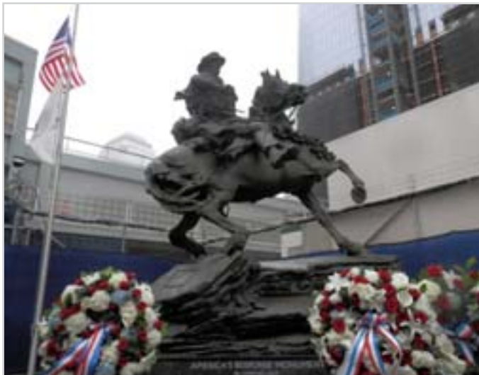
Jezdecký pomník na Ground Zero v New Yorku byl odhalen v roce 2011 k desetiletému výročí útoku na obchodní světové centrum

Při přípravě na náš rozhovor jsem se dočetl, že na místě newyorských dvojčat na Ground Zero je instalován jezdecký pomník amerického vojáka, který znázorňuje současného příslušníka speciálních jednotek, které jsou v zemích